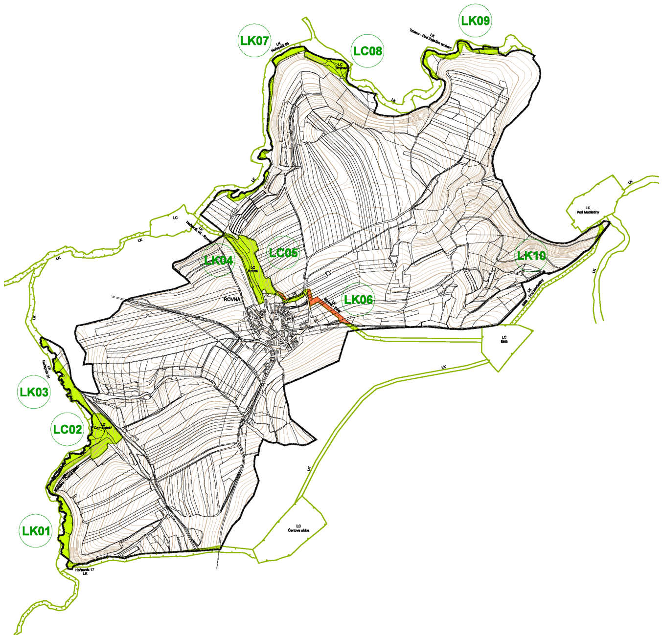
SCHÉMA ÚZEMNÍHO SYSTÉMU EKOLOGICKÉ STABILITY